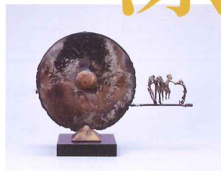
上段左から：高橋節郎《星座物語》1994年、高橋節郎《蜃気楼「空中都市」》1961年 下段左から：井田照一《Wind Dance》1973年、堀浩哉《波-15》1985年、マックス・クリンガー《手袋（作品番号VI）-第4巻：救助》1881年、チェコ・ボナノッテ《網渡り師たち-対照》1987-90年